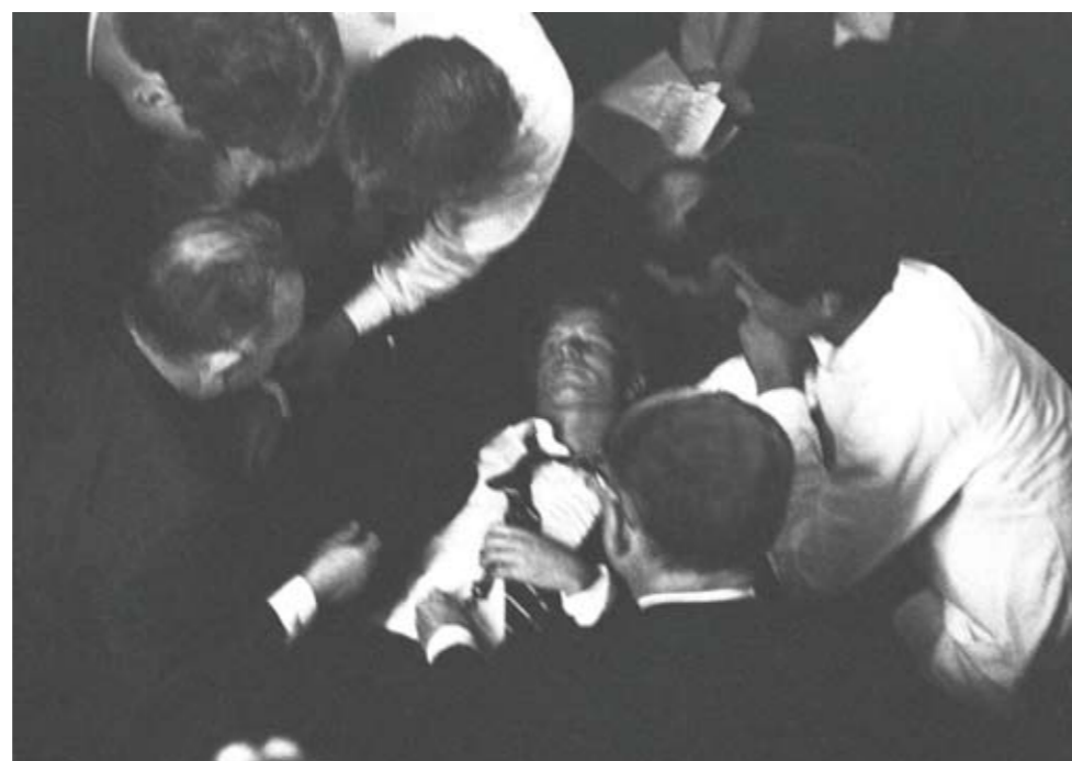
Senator Robert F. Kennedy, Ambassador Hotel, Los Angeles, 1968