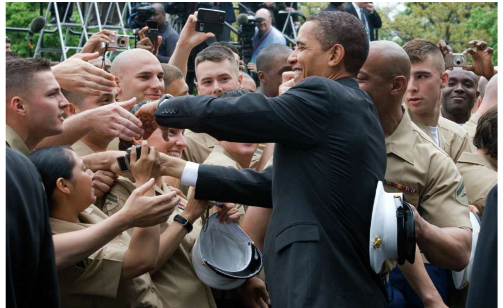
President Barack Obama, the White House, Washington, DC, 2009