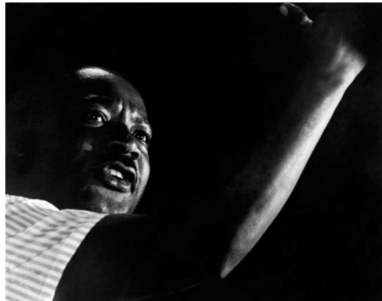
Dr. Martin Luther King, Jr. on the Meredith March, Mississippi, 1966

Represented by: Staley Wise Gallery New York, USA Fahey Klein Gallery, Los Angeles, USA Holden Luntz Gallery, Palm Beach, USA Jackson Fine Art, Atlanta, USA