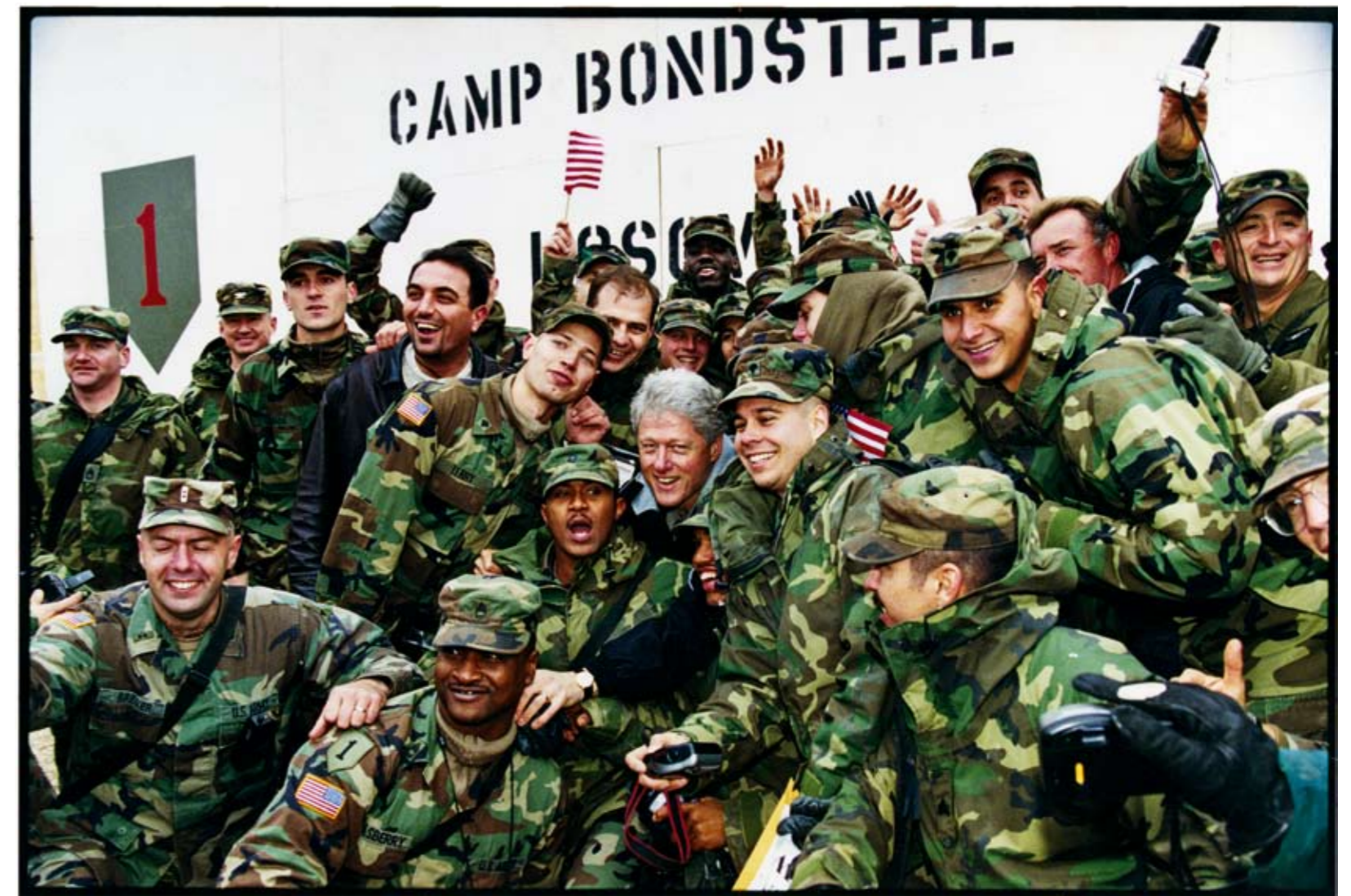
President Bill Clinton, Camp Bonsteel, Bosnia, 1999

I have just finished a book about Bobby Fisher, the chess grandmaster. I have finished a book on New York and its icons, while in March-April 2012 a book about the Beatles for Taschen publishers will be released. By the way, I would also like to show in Milan.