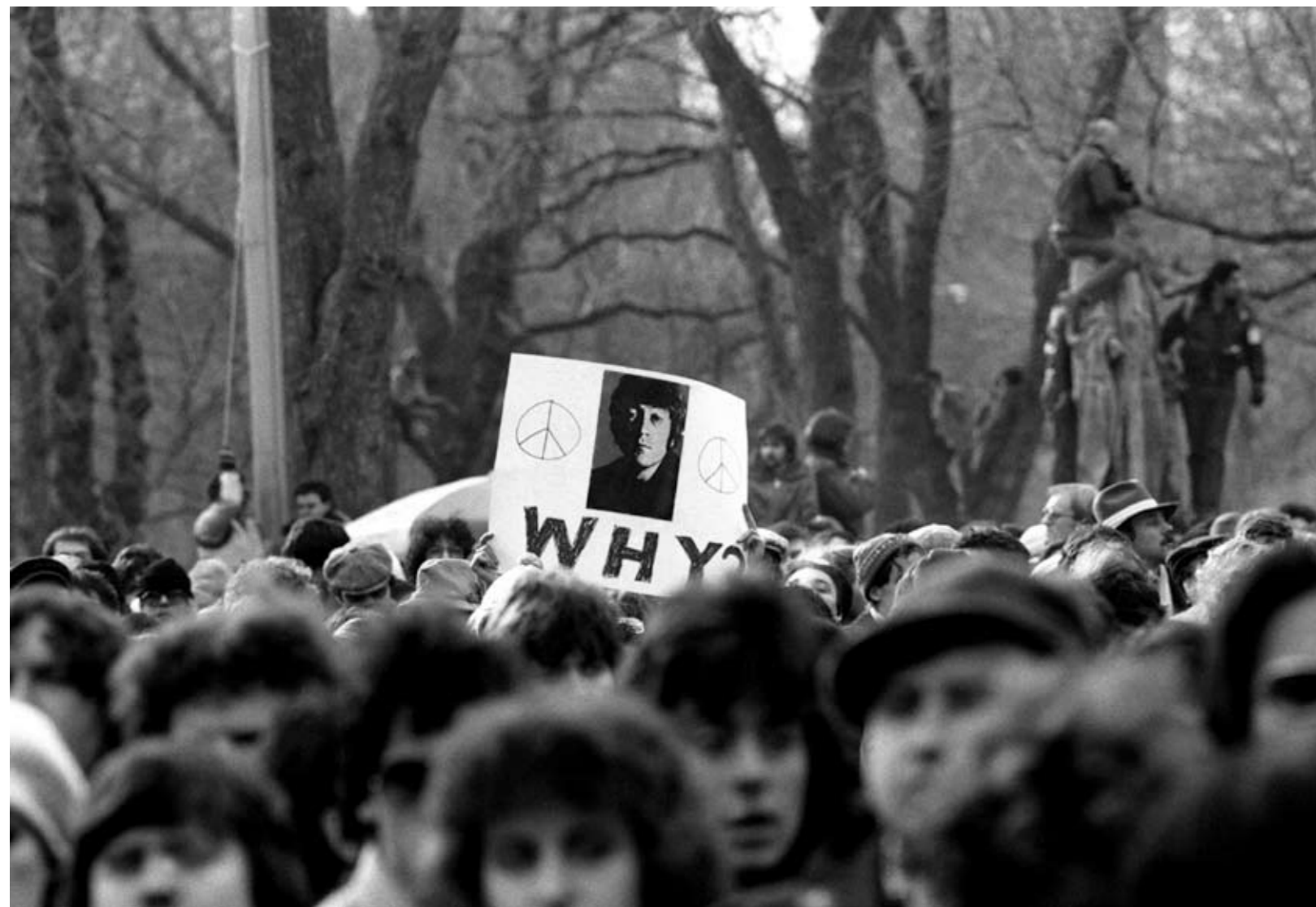
WHY? Memorial to John Lennon, Central Park, New York City, 1980