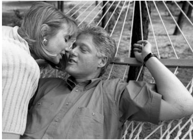
President and Mrs. Clinton, at home in Arkansas just after he was elected President of the US, 1992