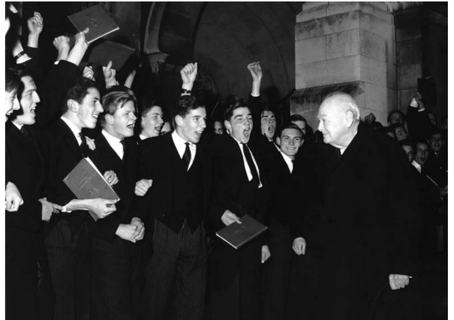
Sir Winston Churchill, Harrow School, England, 1964