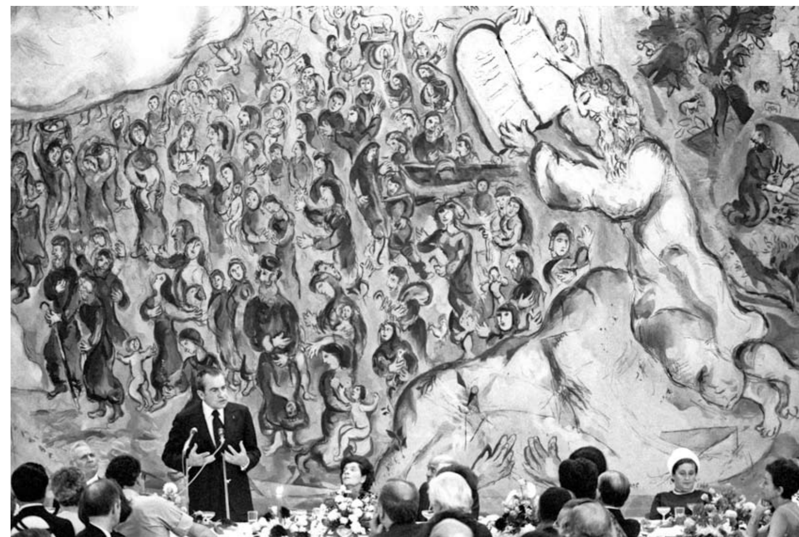
President Richard Nixon at the Knesset, Israel, 1974