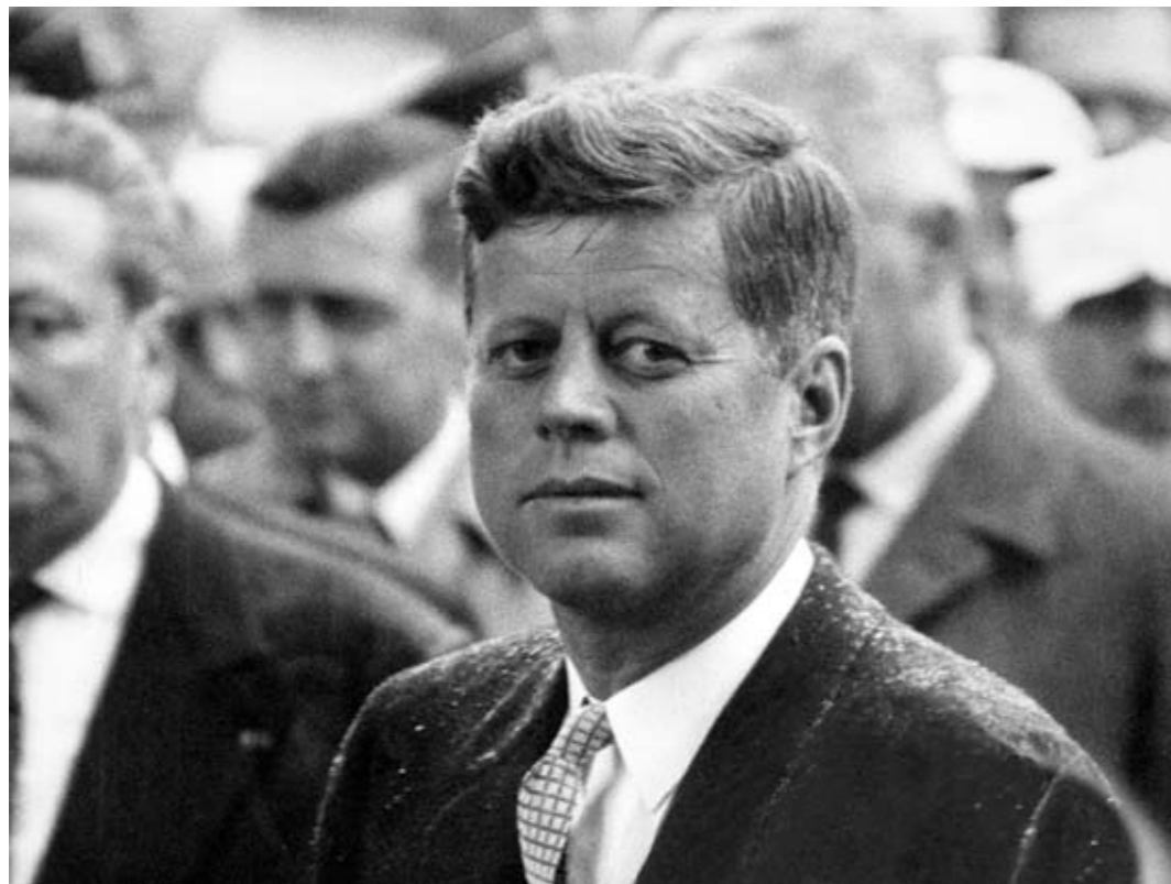
President John F. Kennedy, Paris, 1961